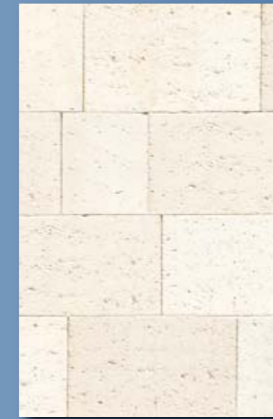
Placage aspect coquillère