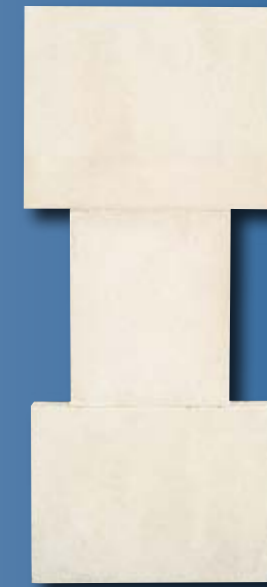
Placage aspect pierre