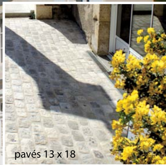
pavés 13 x 18