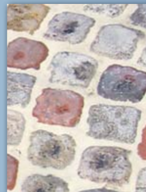
ton multicolore vieilli *