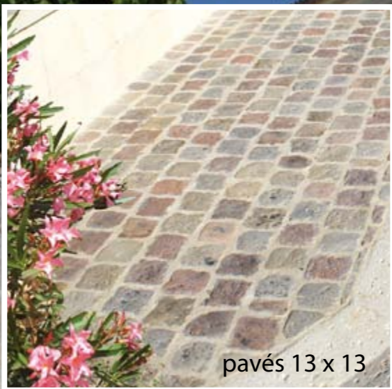
pavés 13 x 13