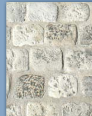
ton pierre vieilli *

Pavés multi-formats de 15 formes différentes* indissociables, épaisseur 3.5 et 6